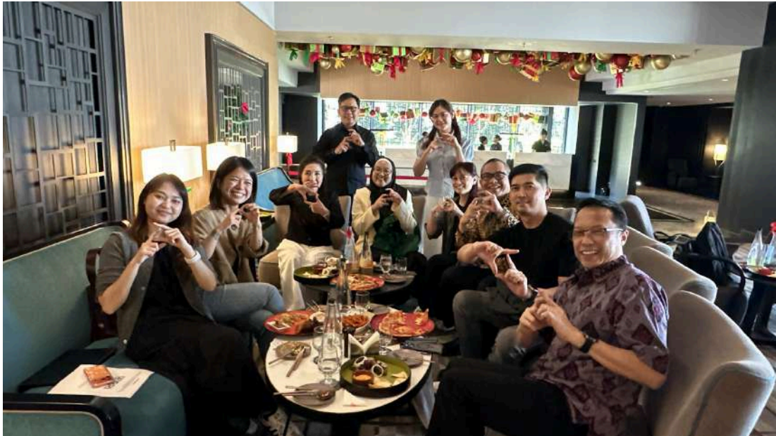
Pertemuan antara Jaringan PRIMA dan PayNet membahas Akseptasi Cross-border QR Payment di G Hotel Gurney, Penang, Malaysia (2/12)

Penang, Malaysia, 17 Desember 2025 – PT Rintis Sejahtera selaku pengelola Jaringan PRIMA dan salah satu lembaga switching nasional terus menunjukkan komitmennya dalam memperkuat konektivitas pembayaran antarnegara Indonesia dan Malaysia. Melalui forum diskusi “Akseptasi Layanan Cross-border QR Payment (QRIS) di Malaysia”, diskusi kali ini dihadiri oleh 2 mitra Jaringan PRIMA, yaitu BCA dan BRI serta pelaku sistem pembayaran Malaysia PayNet dan Touch ‘n Go (TNG Digital) untuk membahas perkembangan, tantangan, dan arah penguatan ekosistem pembayaran digital kawasan.